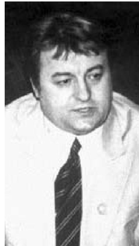
Corneliu Vadim Tudor