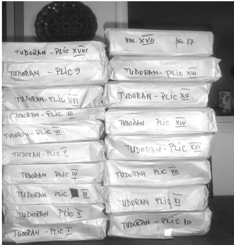
Dosarul de Securitate al lui Dorin Tudoran