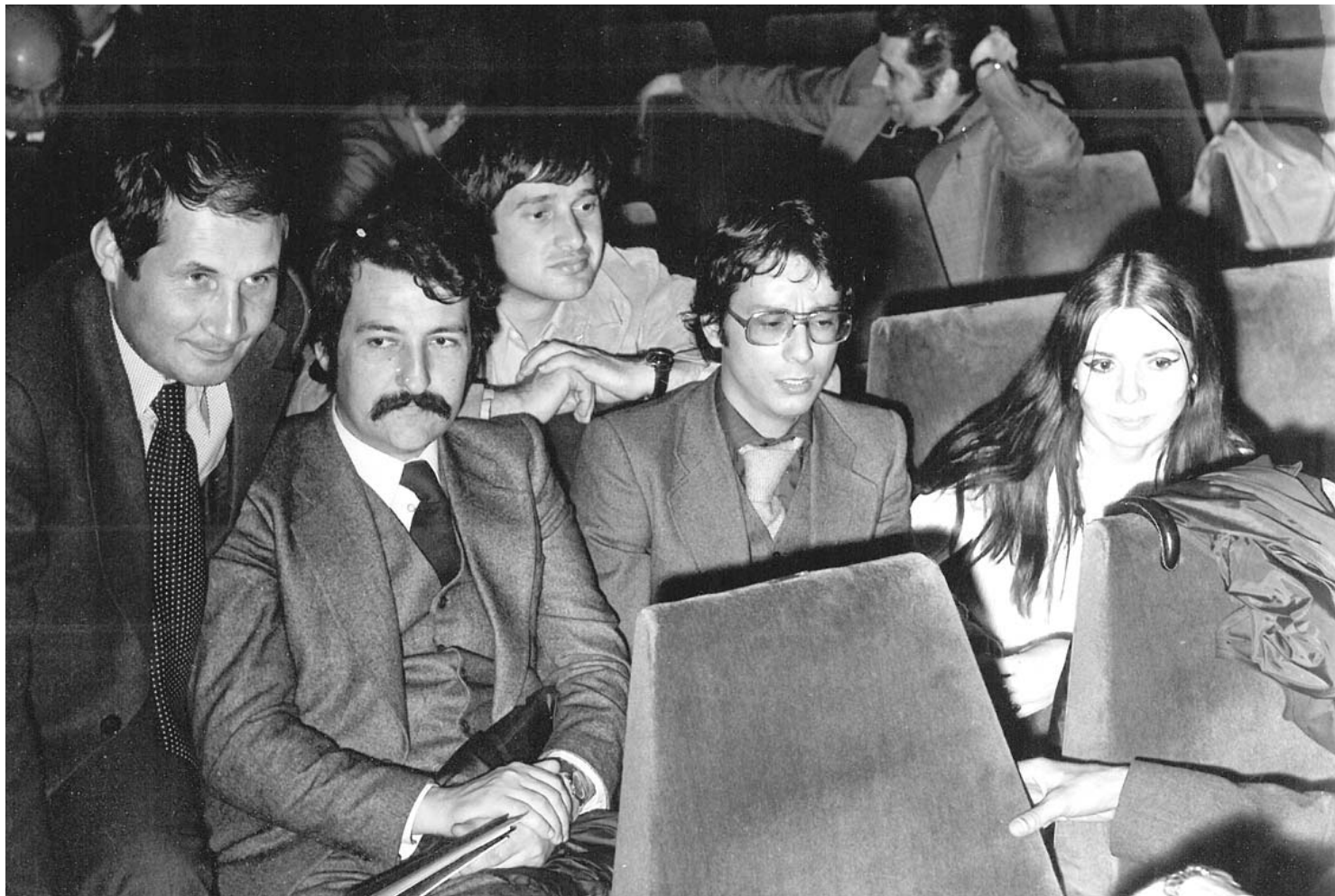
Iași, 1977, Festivalul de poezie „Mihai Eminescu“.

După cum scrie Dumitru Popescu, „Ceaușescu a venit acasă impresionat de importanța acordată acolo rolului conștiinței în construirea comunismului. Ne-a cerut tuturor, întregului partid să-l ur-