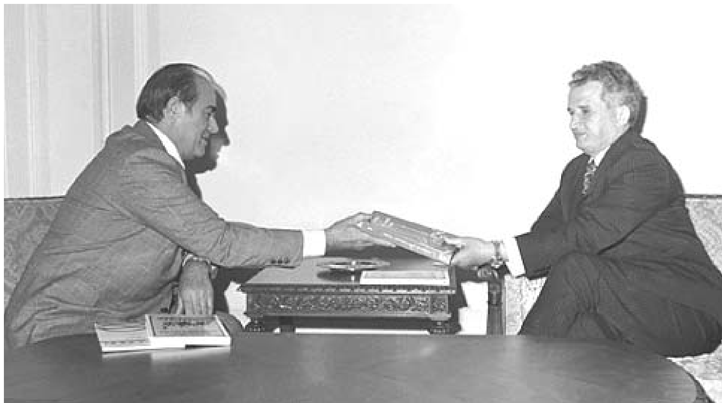
Iosif Constantin Drăgan și Nicolae Ceaușescu

Într-o Românie care, spre deosebire de celelalte țări comuniste, nu rupsesse în 1967 relațiile diplomatice cu Israelul și, în consecință, nu lansase o campanie oficială antisionistă, apare la sfârșitul anilor '70 o serie de articole cu conținut antisemit, evident tolerate și încurajate de autorități. „În paginile revistei patronate de I[osif] C[onstantin] Drăgan și difuzate cu sprijinul Securității în România, Noi, Tracii, au fost publicate texte de o virulență xenofobă și antisemită care nu ar fi putut